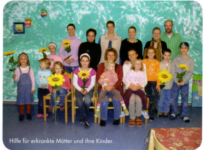
Hilfe für erkrankte Mütter und ihre Kinder.