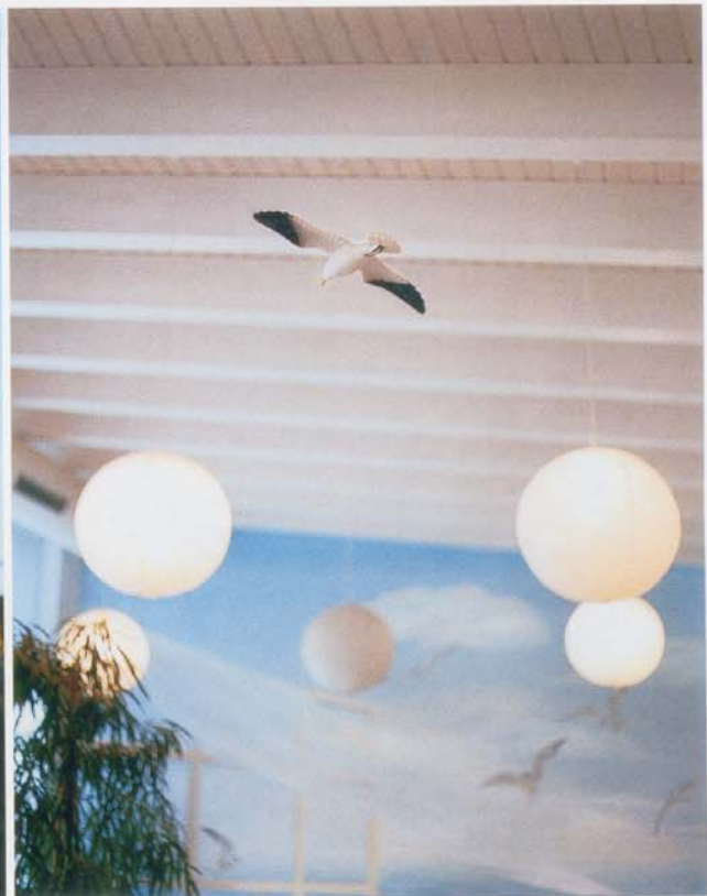
Die Klinik Ostsee-Deich (l.) liegt nur 200 Meter vom Meer entfernt, eingebettet in die Lübecker Bucht. Auch innen (r.) spiegelt sich das Leben des Ostseeheilbads Grömitz wieder: Die Gäste erblicken fast überall Meereswogen und Möven.